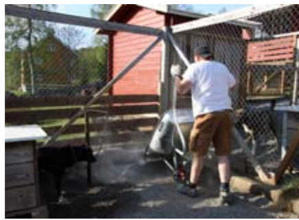
10 tonn med singel har i år blitt fylt på.