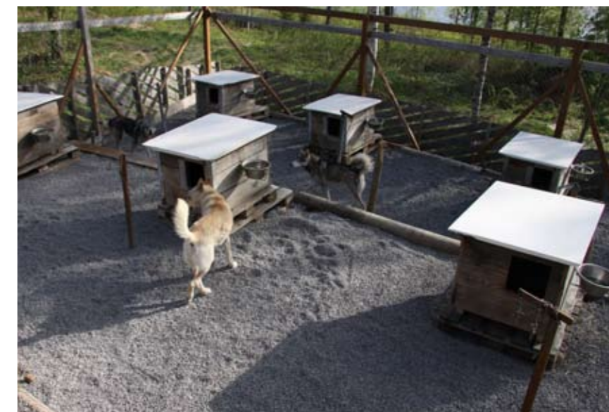
Alle husene er cirka 6 år gamle og vedlikeholdsfrie.