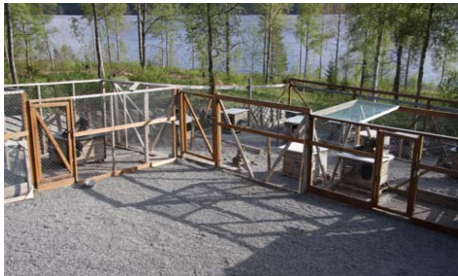
Singel drenerer godt og her lukter det ikke hundepiss.