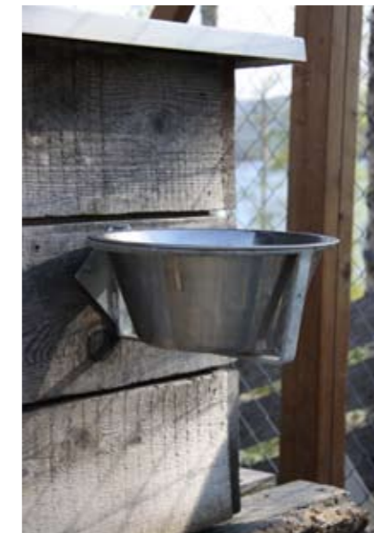
Skålloppheng fra Felleskjøpet.

Vi har plassert alle hundehus slik at hundene kan ligge i skyggen av huset. I tillegg har vi satt opp levegger mot syd.